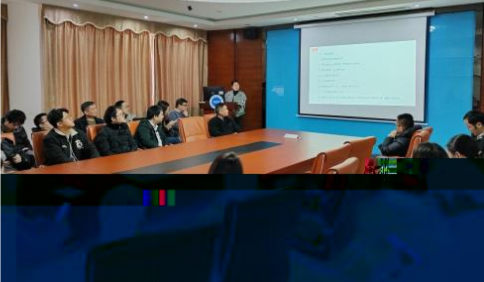
图 员工专业技 培