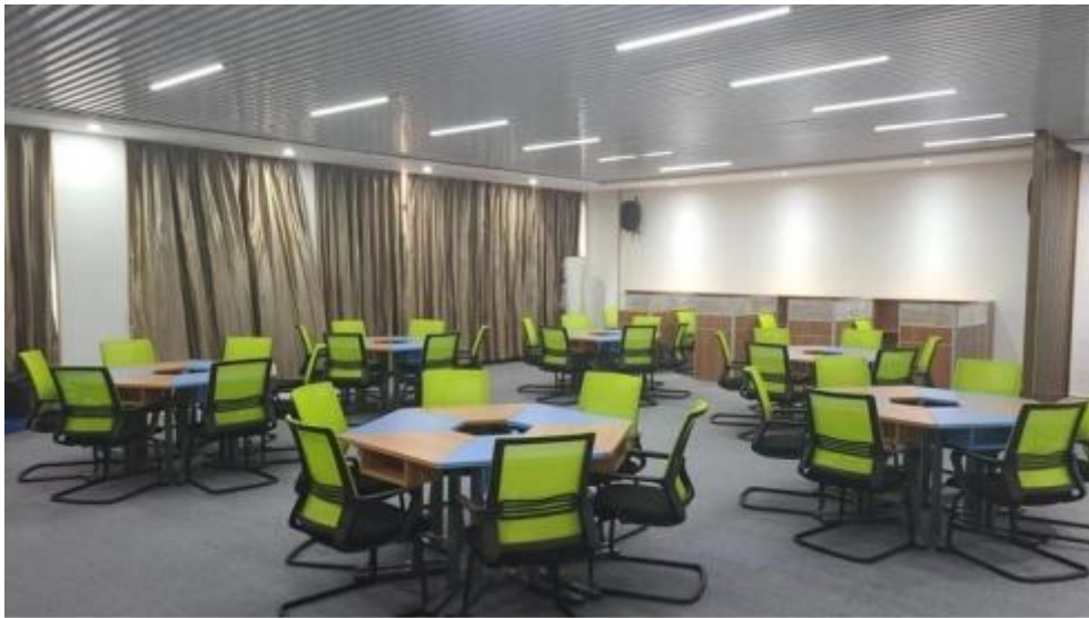
图 智慧 售 中心