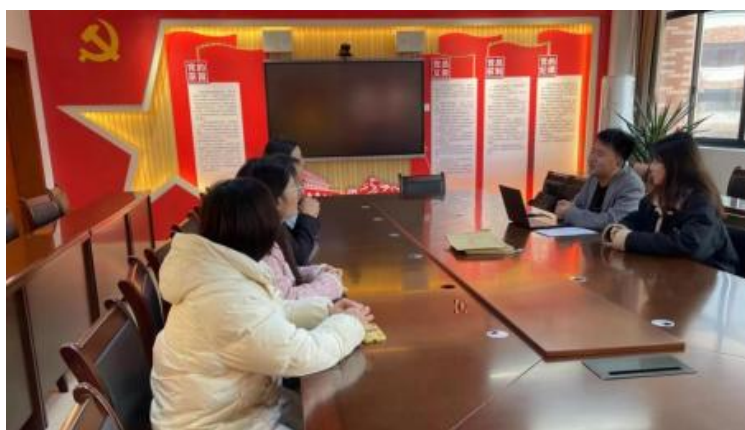
图 5-1 企开展学术 交 会