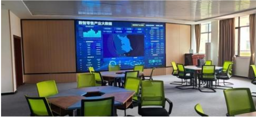
图 智慧 售 中心