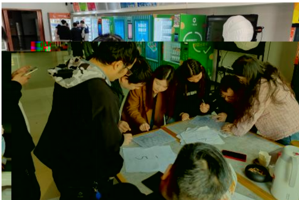
图 卓 团 建 共